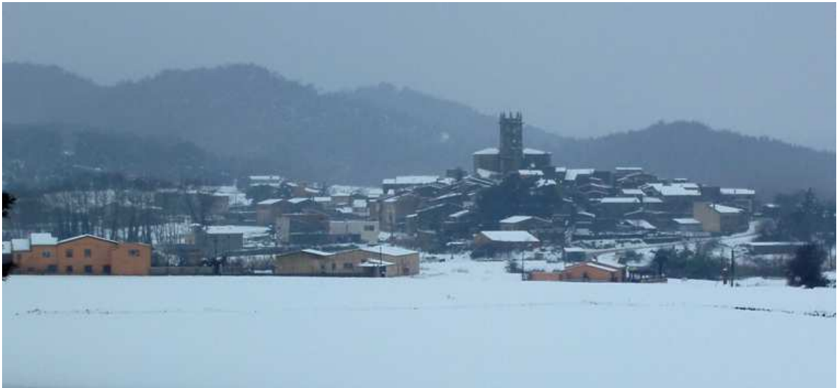
28 de gener de 2006. La Pera.