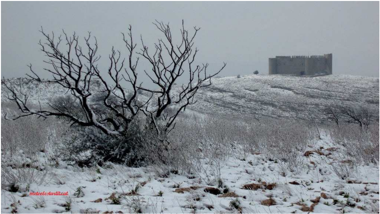
27 de gener de 2006. El Montgrí, vist des de dalt del Mont Pla.