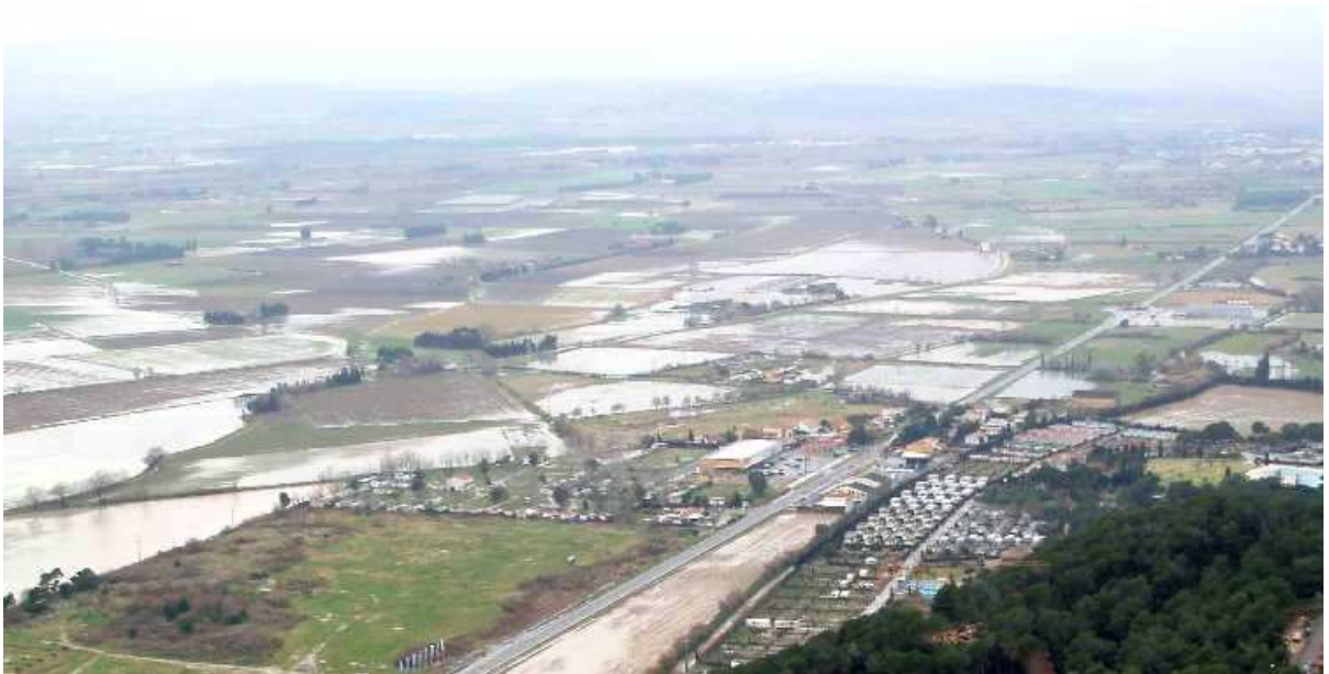
Camps inundats després d'aquell episodi.