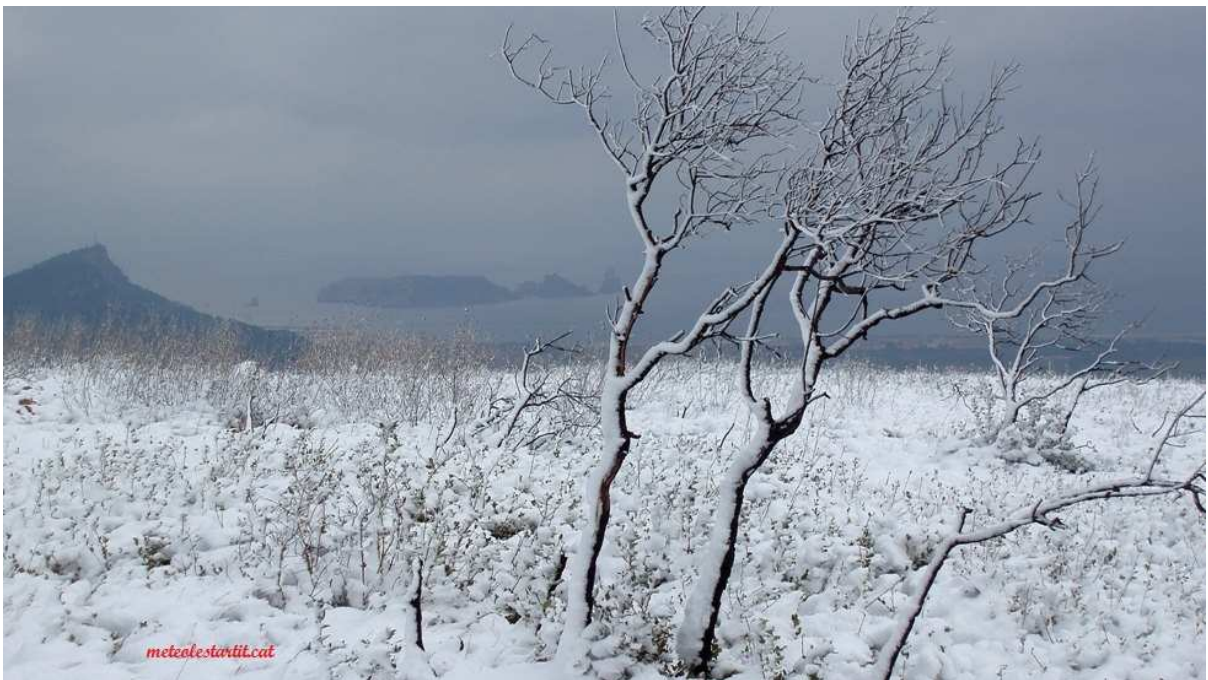
Les Medes vistes des de dalt del Mont Pla.