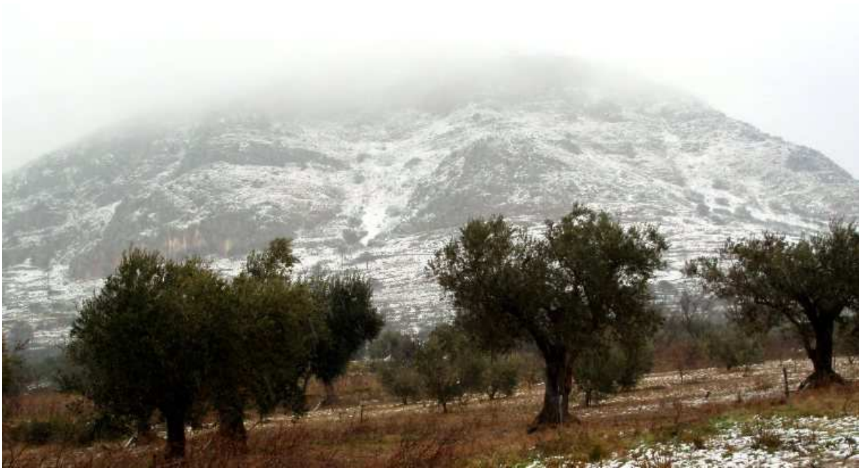
El Montgrí des de la Ronda Pau Casals.