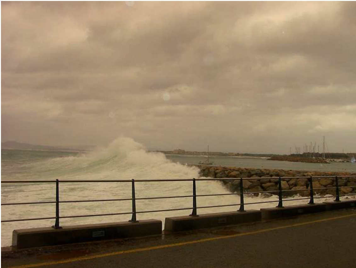
Temporal de mar - 3 de maig de 2004.