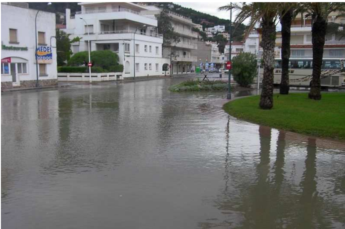
3 de maig de 2004. Inundació del Passeig Marítim de l'Estartit a causa del temporal.