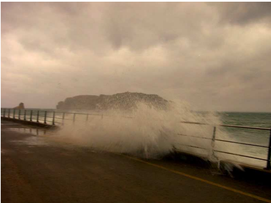
Temporal de mar - 3 de maig de 2004.