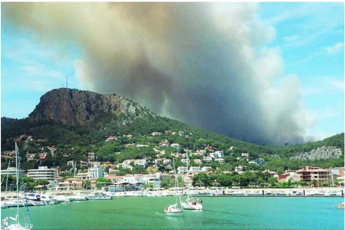
Des del port la imatge era espectacular.