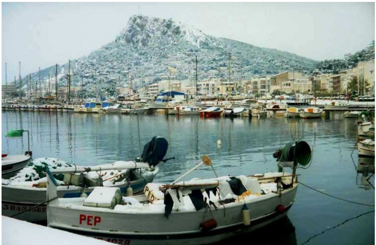
L'Estartit, des del port.