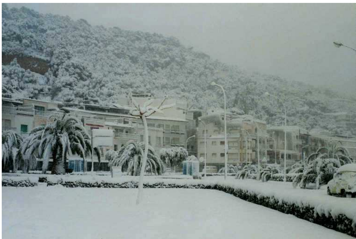
Passeig Marítim de l'Estartit.