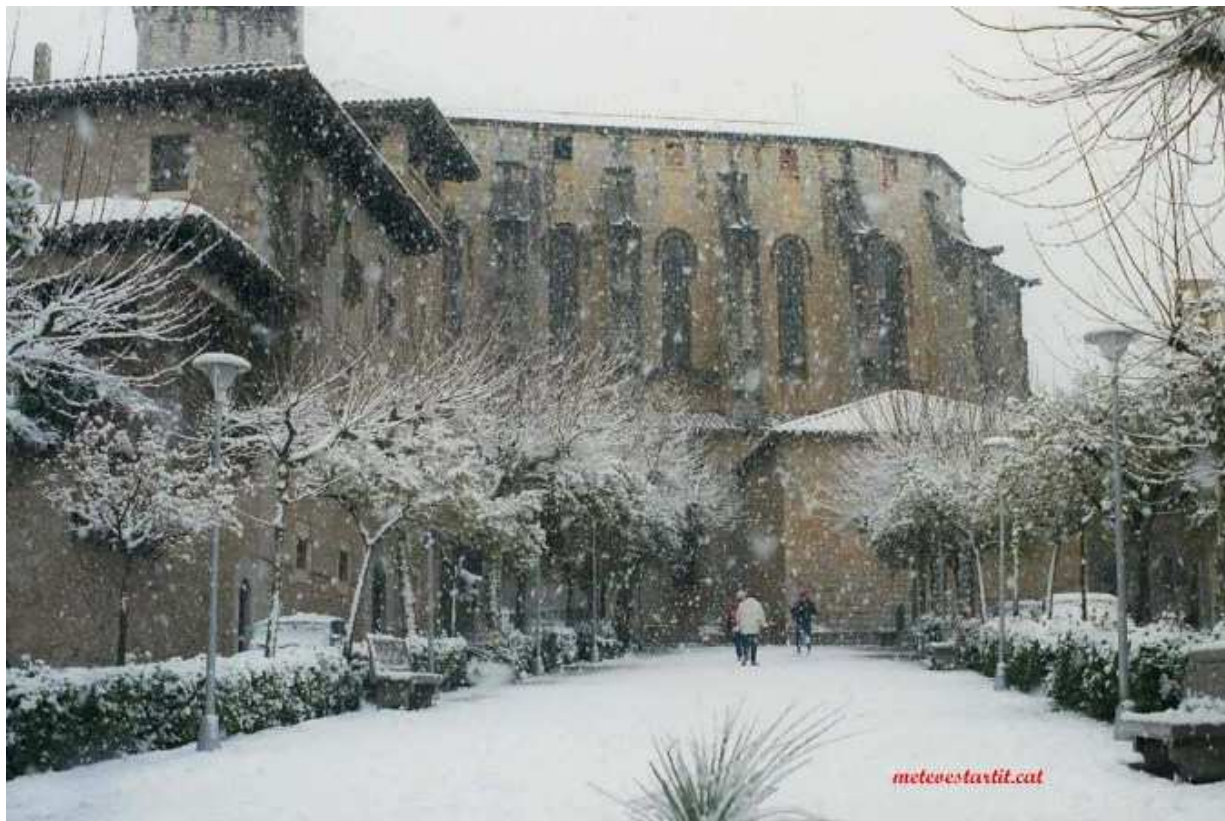
Passeig de l'Església de Torroella.