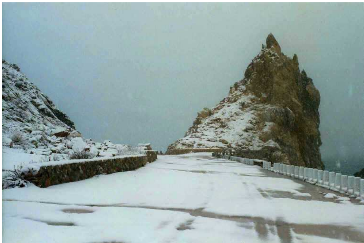
Final del Passeig del Molinet de l'Estartit.