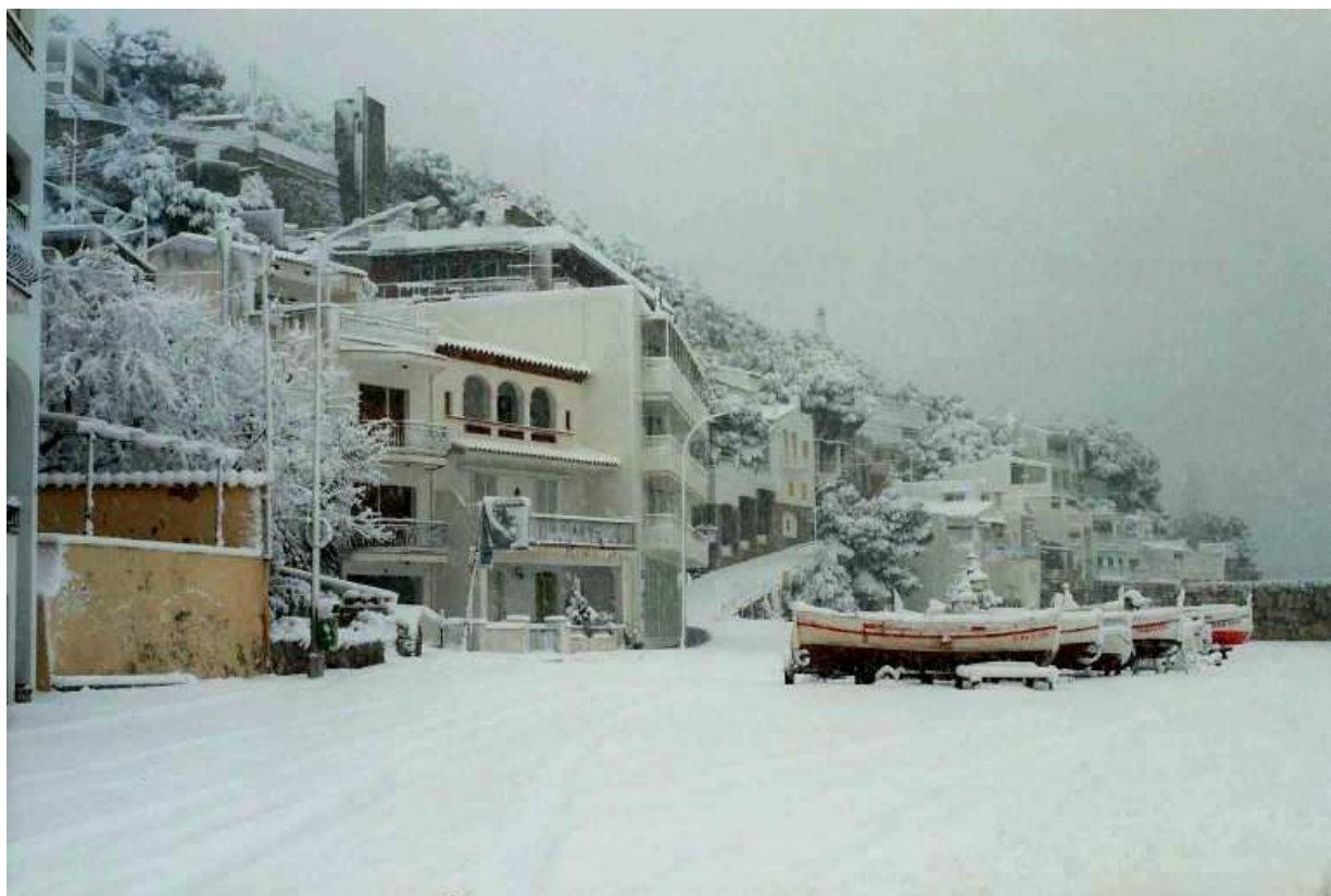
Esplanada del moll de l'Estartit.