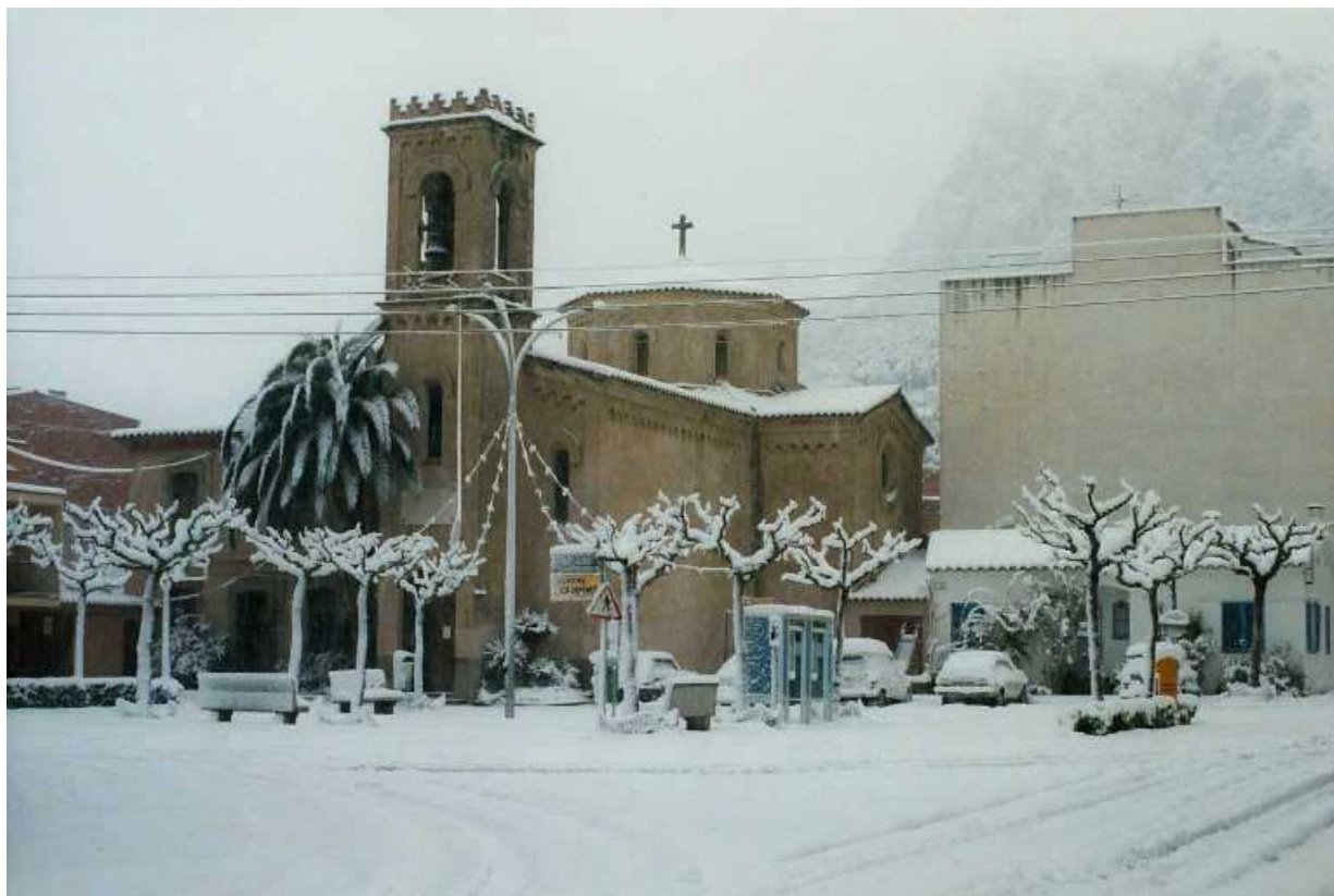
Plaça de l'Església de l'Estartit.