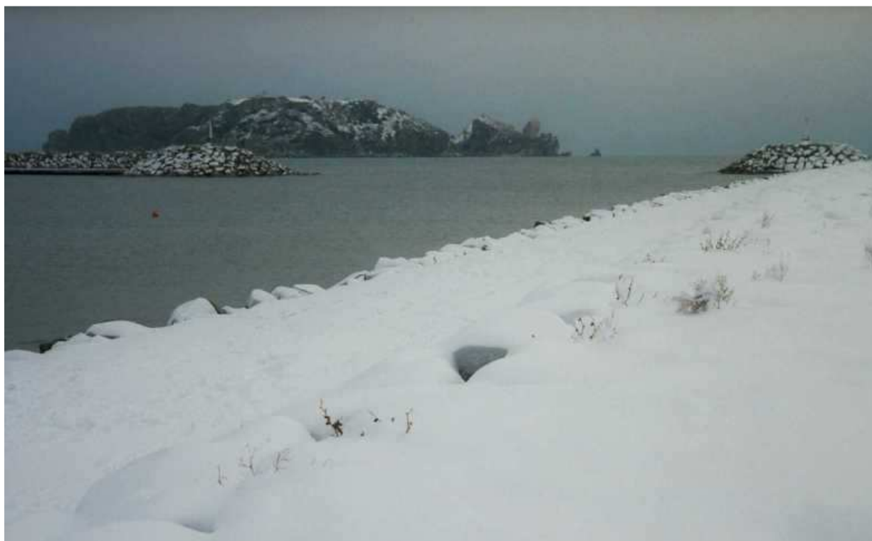
La Meda des de l'espigó de garbí de l'Estartit