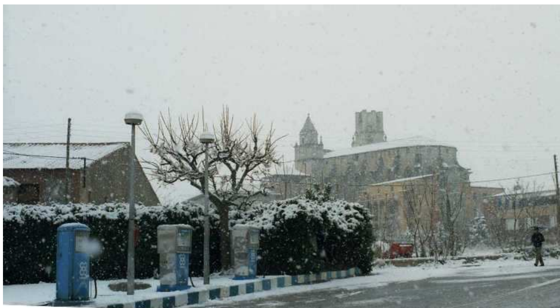
Antiga benzinera de Torroella a la plaça del Lledoner