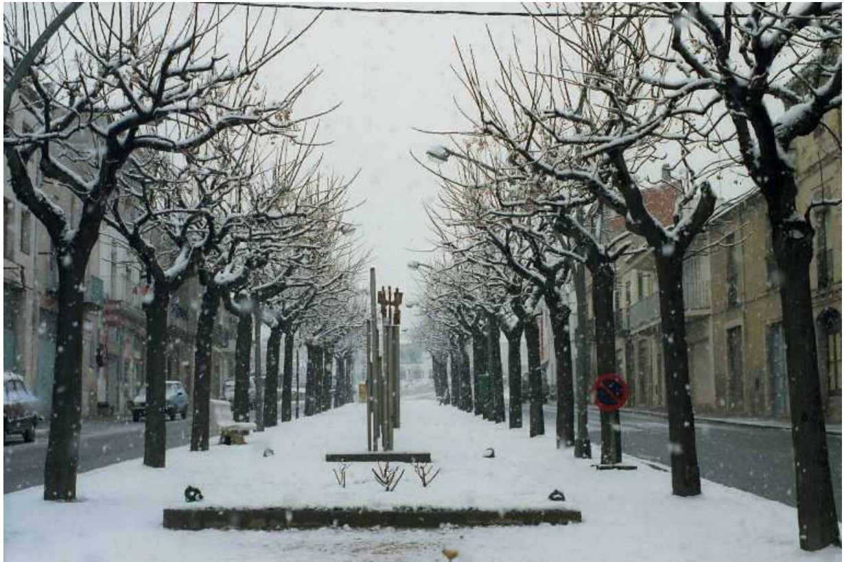
Passeig de Catalunya de Torroella.