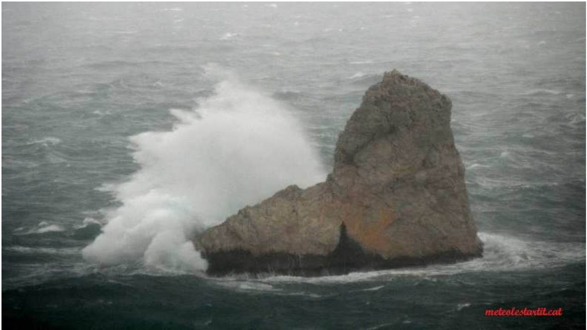
Cop de mar picant al Medellot - 1 de març de 2013.