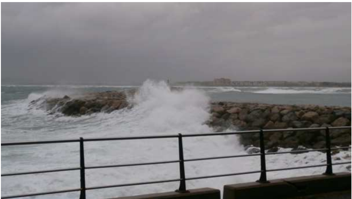
Cop de mar picant a l'espigó de llevant del port de l'Estartit - 1 de març de 2013.