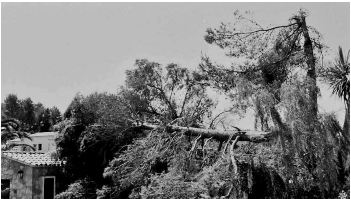
Un parell d'imatges dels efectes de la tempesta.