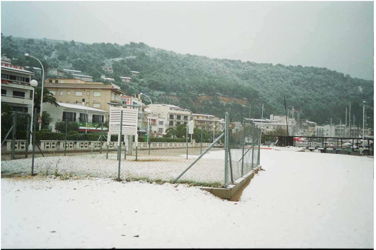
Aspecte de l'Estartit des de l'estació meteorològica el 22 de gener de 1992.