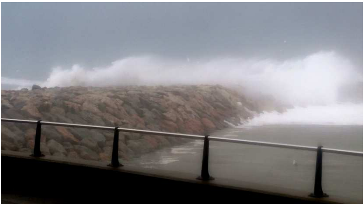
6 de març de 2013. Mar desfeta a l'espigó de llevant, a causa del fort vent i el temporal de mar.