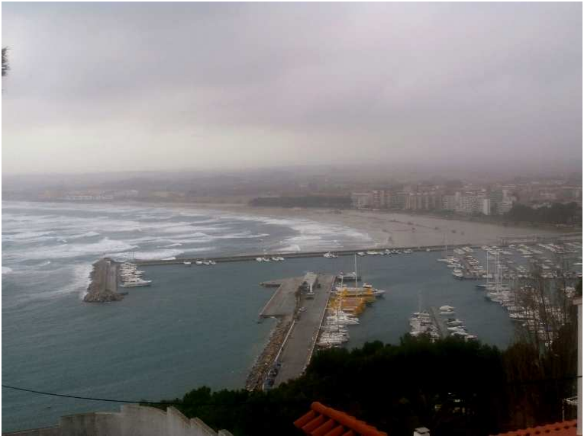
5 de març de 2013. La platja va quedar totalment inundada.