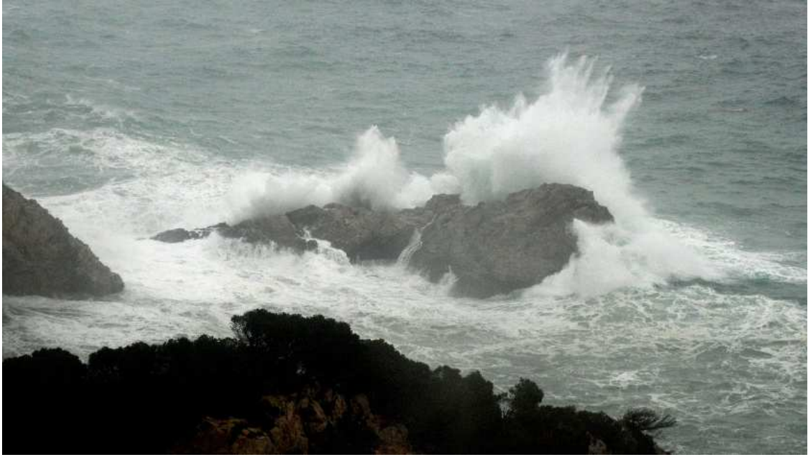
6 de març de 2013. Cop de mar picant a la Punta de les Salines.