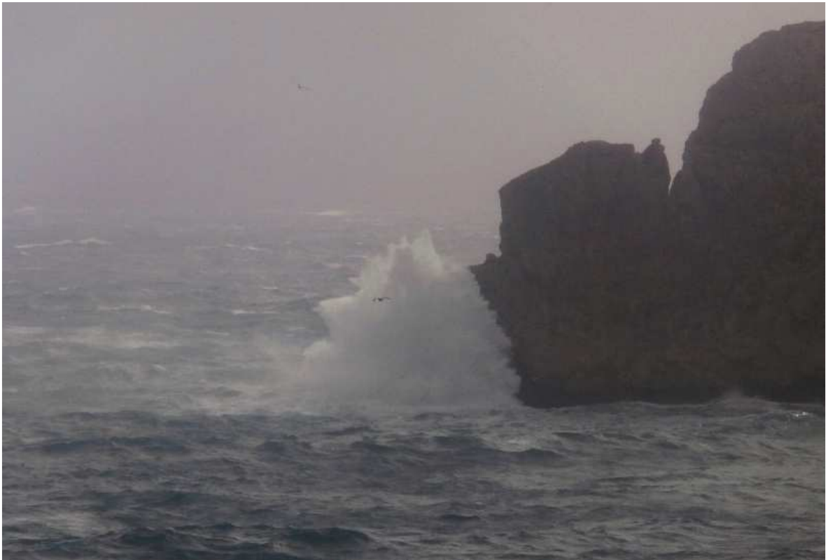
5 de març de 2013. Cop de mar picant a la Punta de la Coetera.