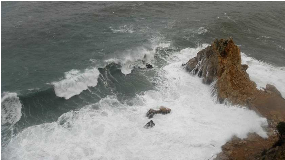
6 de març de 2013. Cops de mar enfilant-se a la Bleda.