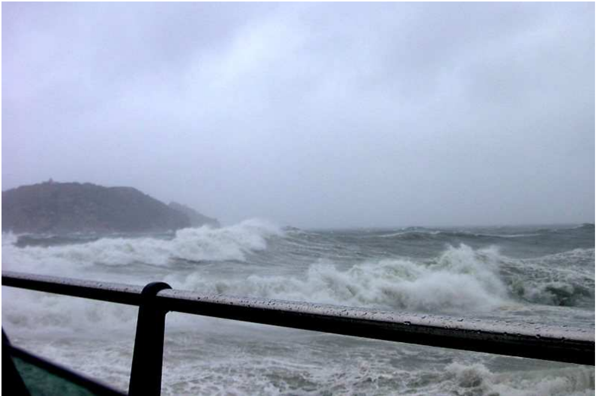
Temporal al mar el 16 d'abril de 2004.