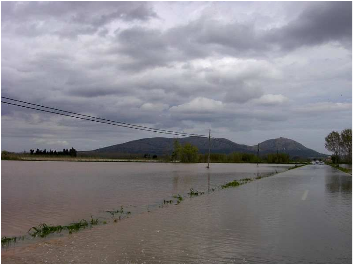
17 d'abril de 2004. Inundació a la carretera de Torroella a Serra de Daró.