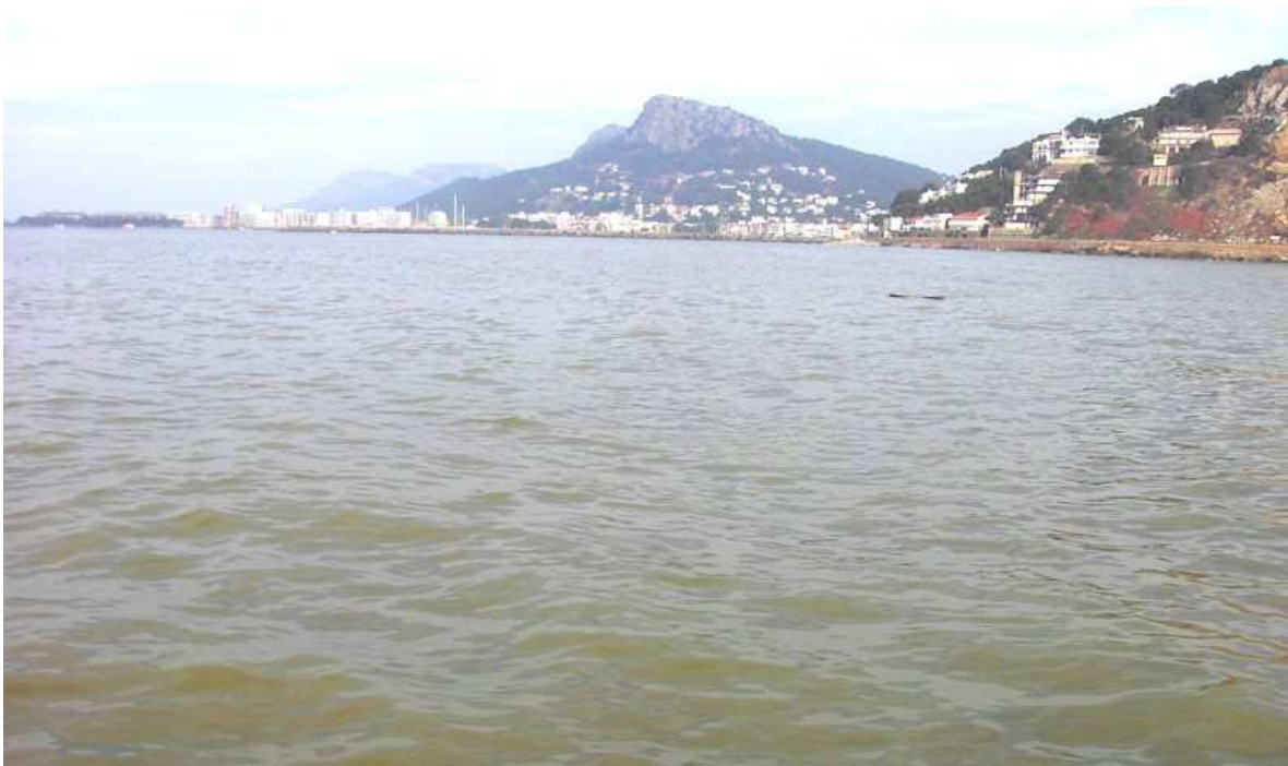
18 d'abril de 2004. A tota la badia, l'aigua era tèrbola a causa de l'abundant cabal del Ter.