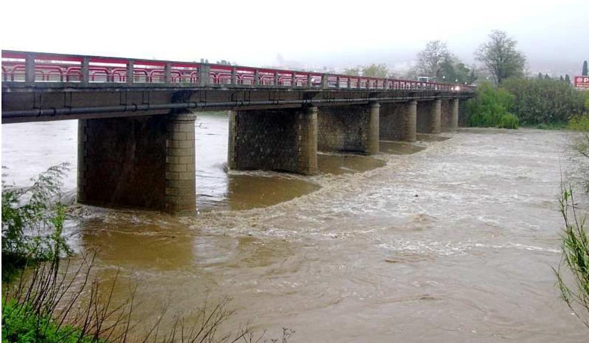
16 d'abril de 2004. El cabal del Ter va augmentar a causa de pluges generalitzades.