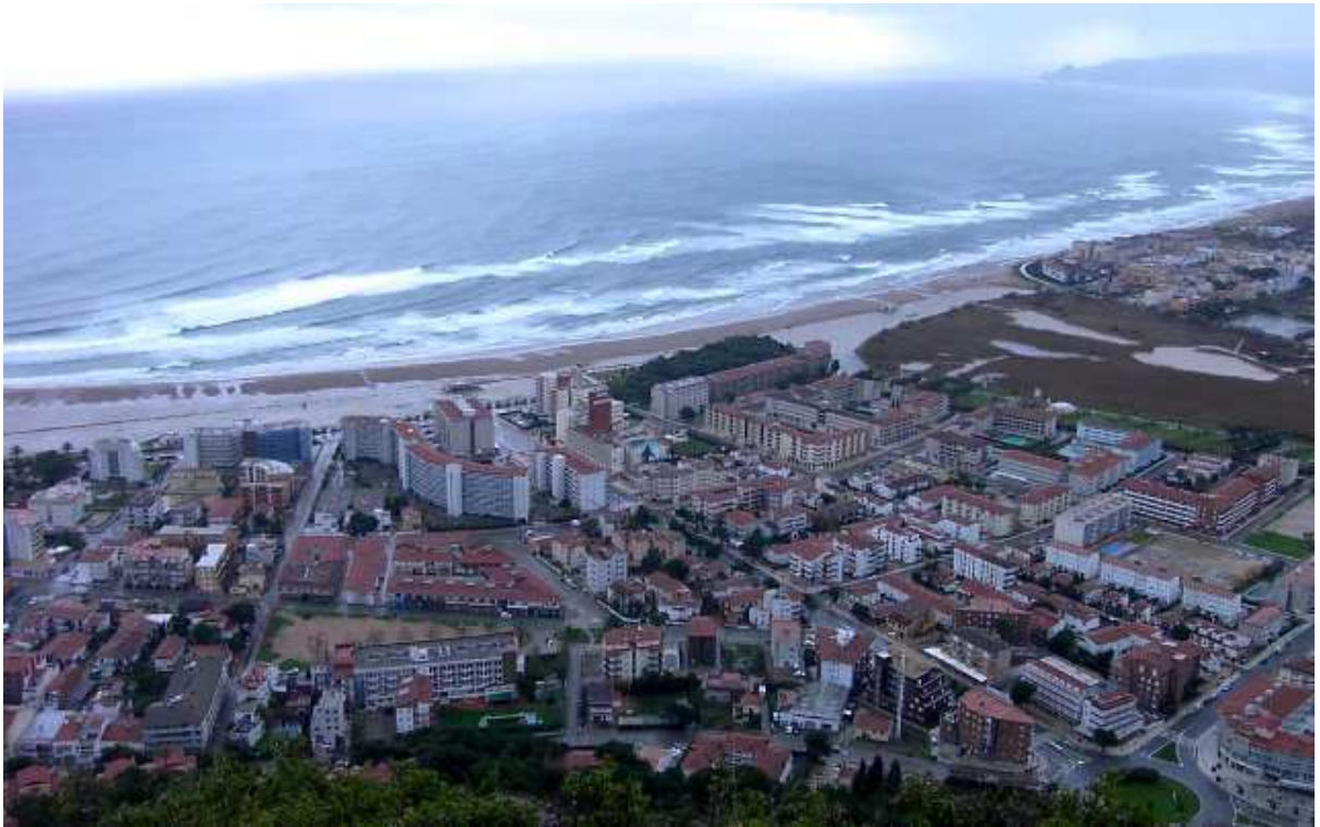
La mar també es va remenar aquell dia de Reis de 2003.