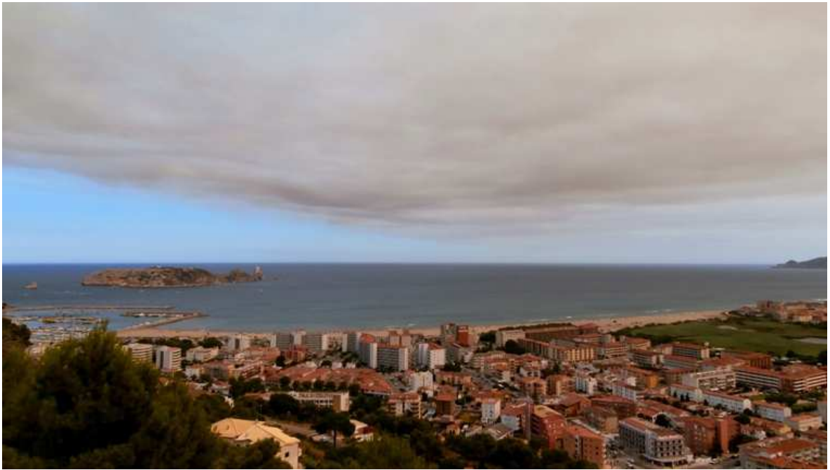
El fum aquell dia va tapar el cel de l'Estartit.