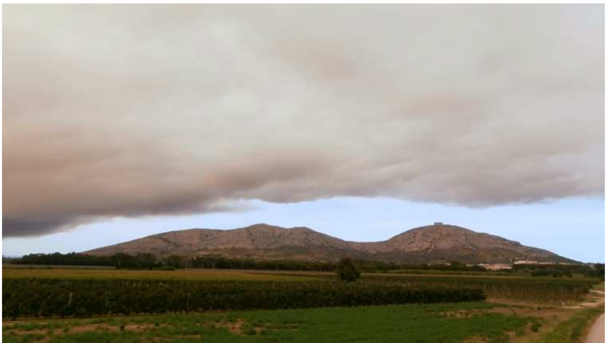
Ni Torroella ni els pobles veïns es van escapar d'aquell del ple de fum.