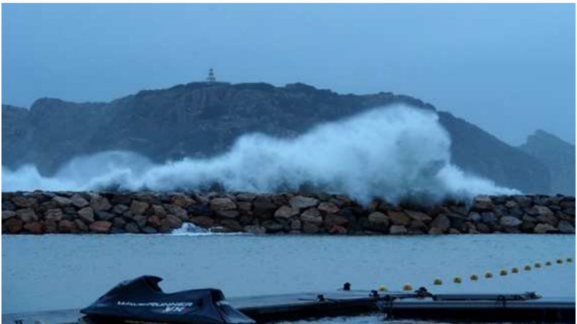
Cop de mar saltant l'espigó de llevant de l'Estartit (dia 23)

Finalment, pluja menys important durant el matí del dia 23, els darrers plugims acompanyats d'un xic de fang. El total de l'episodi va deixar 141,5 mm. de pluja, en general benvinguda, després d'un any extremadament amb poca precipitació. En alguns casos va malmetre alguns camps, amb reguers que s'emportaven la terra. La situació més greu d'aquests dies es va produir prop de Tarragona, on els aiguats van ser força més destacables, a la zona del riu Francolí, on hi va haver alguns morts i desapareguts.