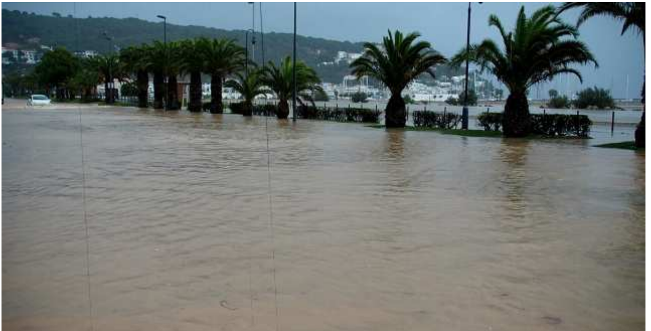
Passeig Marítim de l'Estartit inundat després de la tempesta de la tarda del dia 22.