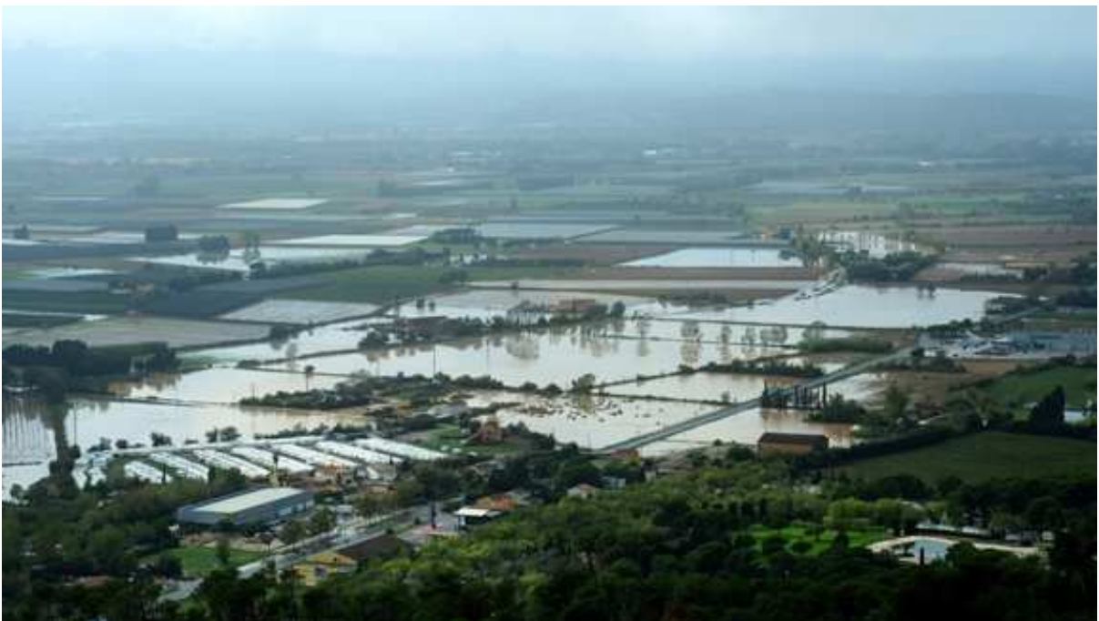
Plana entre l'Estartit i Torroella inundada (dia 23)