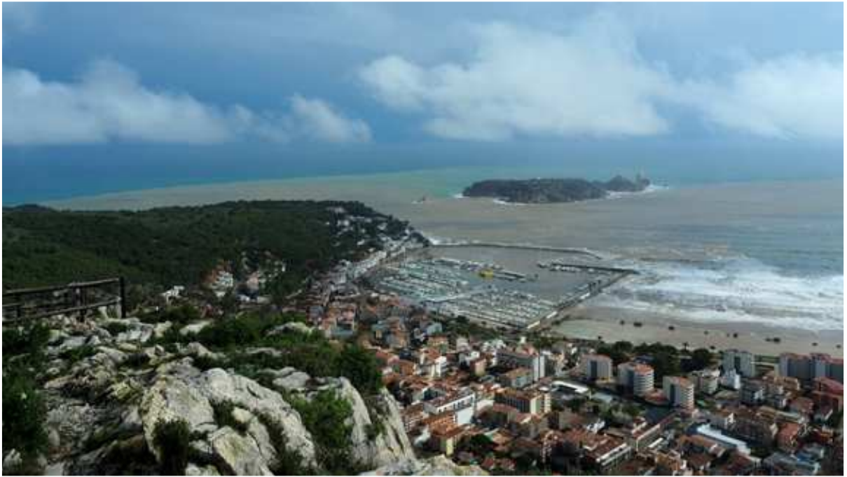
Ploma d'aigua del Ter arribant al mar (tarda del dia 23)