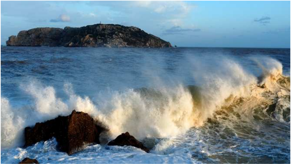
Temporal de mar (tarda del dia 23)