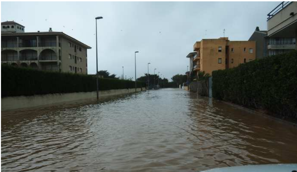
Dia 22 de gener. Alguns carrers de la urbanització "Els Salats" van quedar inundats.