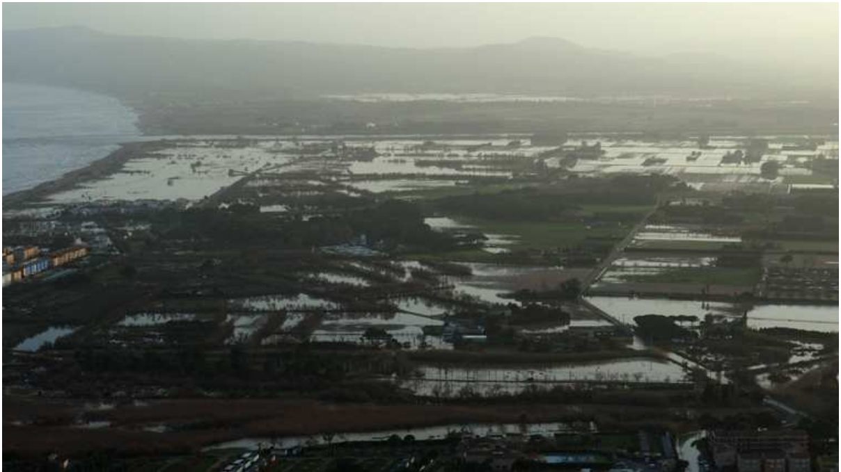
Dia 24 de gener. Camps propers a la part baixa del Ter, totalment inundats.