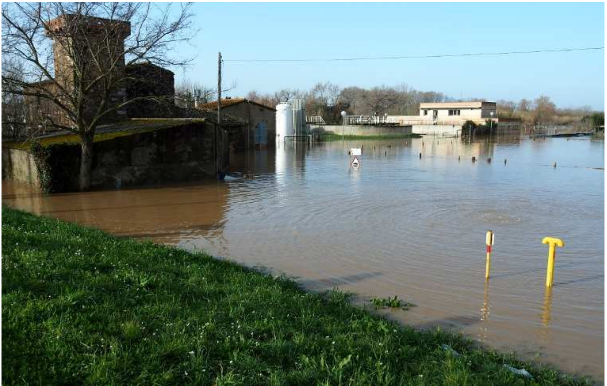
Dia 24 de gener. A banda i banda el Ter d'jes va desbordar aigües amunt. Zona de l'estació de bombeig d'aigües potables de Torroella.