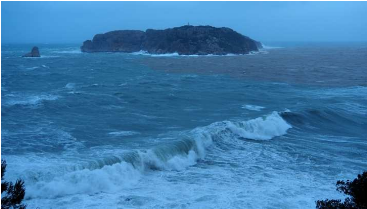
Dia 21 de gener. Eren visibles les grans onades al Freu. Es veia arribar la ploma d'aigua terrosa del ter.