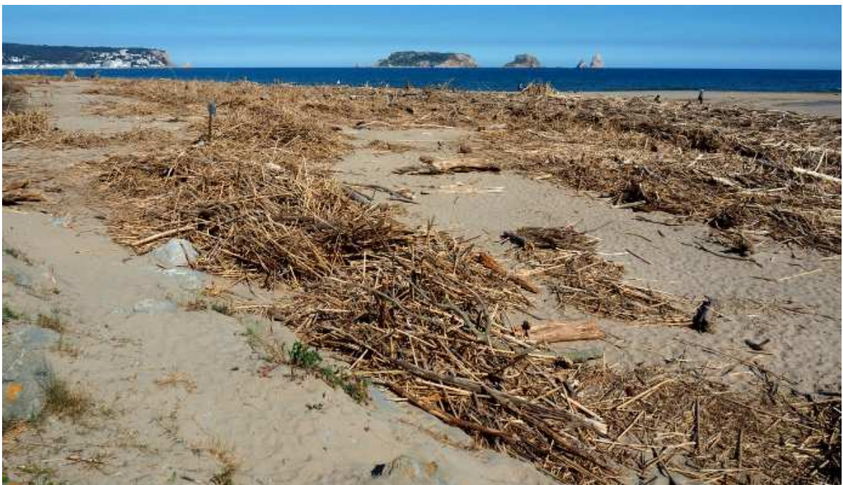
La platja va quedar completament plena de troncs, restes vegetals i altres brosses i objectes arrossegats pel Ter i retornats des del mar amb les onades.