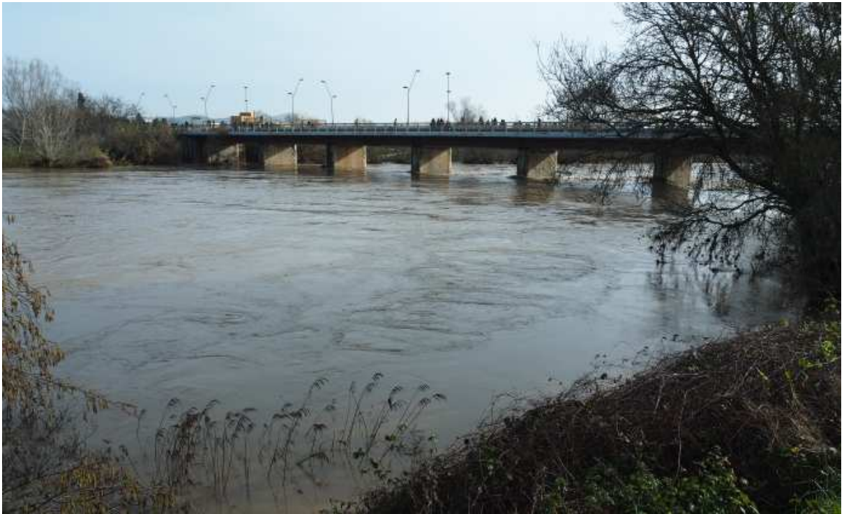
Dia 24 de gener. Durant la nit anterior el Ter va assolir el cabal màxim; possiblement el més alt des del mes de març de 1986.